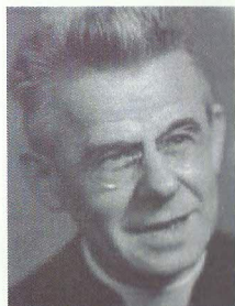
Josef Cardijn (Gründer der Christ- lichen Arbeitnehmer Jugend, CAJ, (1882 - 1967)

„Eine Kirche ohne die Arbeiter ist nicht die Kirche Jesu Christi.“